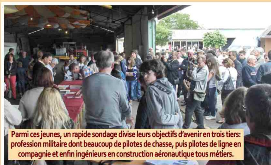
Parmi ces jeunes, un rapide sondage divise leurs objectifs d'avenir en trois tiers: profession militaire dont beaucoup de pilotes de chasse, puis pilotes de ligne en compagnie et enfin ingénieurs en construction aéronautique tous métiers.