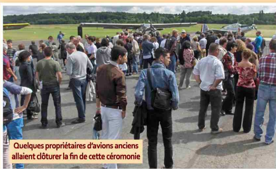
Quelques propriétaires d'avions anciens allaient clôturer la fin de cette cérémonie

Pendant cette année scolaire 2012/2013, 317 jeunes de toute la Région Centre avaient suivi les cours du BIA à raison de 40 heures dans l'année. Puis l'examen du mois de mai permettait à 260 étudiants de valider cette formation.